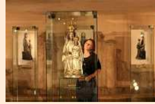
výstava Matka Boží Tuřanská