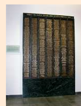
pamětní deska věnovaná obětem války

Otevření Husova sboru v Brně-Králově Poli