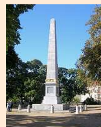
Pomník míru v Denisových sadech

Slavnostní odhalení obelisku - Pomníku míru – na Františkově (Denisovy sady)