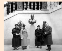
slavnostní odhalení busty Karla staršího ze Žerotína

Návštěva Billa Gatese – zahájení veletrhu Invex 94