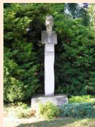
místo posledního odpočinku A. Mrštíka