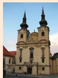
kostel Nanebevzetí Panny Marie

Kostel Nanebevzetí Panny Marie v Zábrdovicích znovu otevřen po rekonstrukci