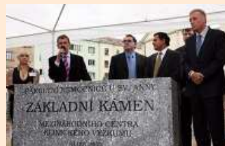
slavnostní poklep základního kamene

Slavnostní poklepání základního kamene Mezinárodního centra klinického výzkumu (ICRC)