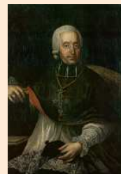
Matěj František Chorinský

1. biskup brněnský (1777–1786), světící biskup královehradecký (1769–1775), světící biskup olomoucký (1775–1777)