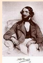
Heinrich Wilhelm Ernst