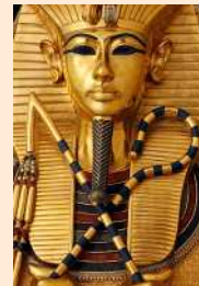
výstava Tutanchamon – jeho hrob a poklady