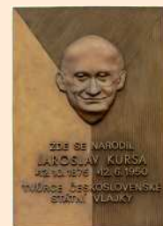
pamětní deska J. Kursy

dlouholetý archivář Ministerstva vnitra, autor české státní vlajky