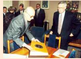
Václav Klaus na Lékařské fakultě Masarykovy univerzity

Návštěva předsedy vlády Václava Klause na Lékařské fakultě Masarykovy univerzity