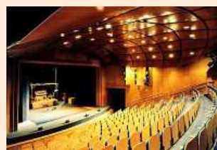
interiér loutkového divadla

Zahájení činnosti Loutkového divadla Radost